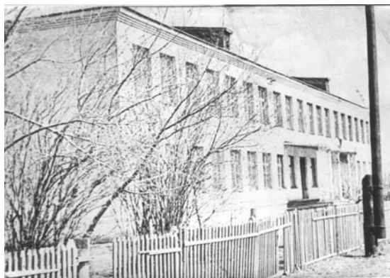
Екатеринославская школа 1960-е годы