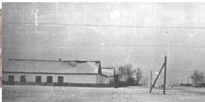
Старая литая школа. 1955г.